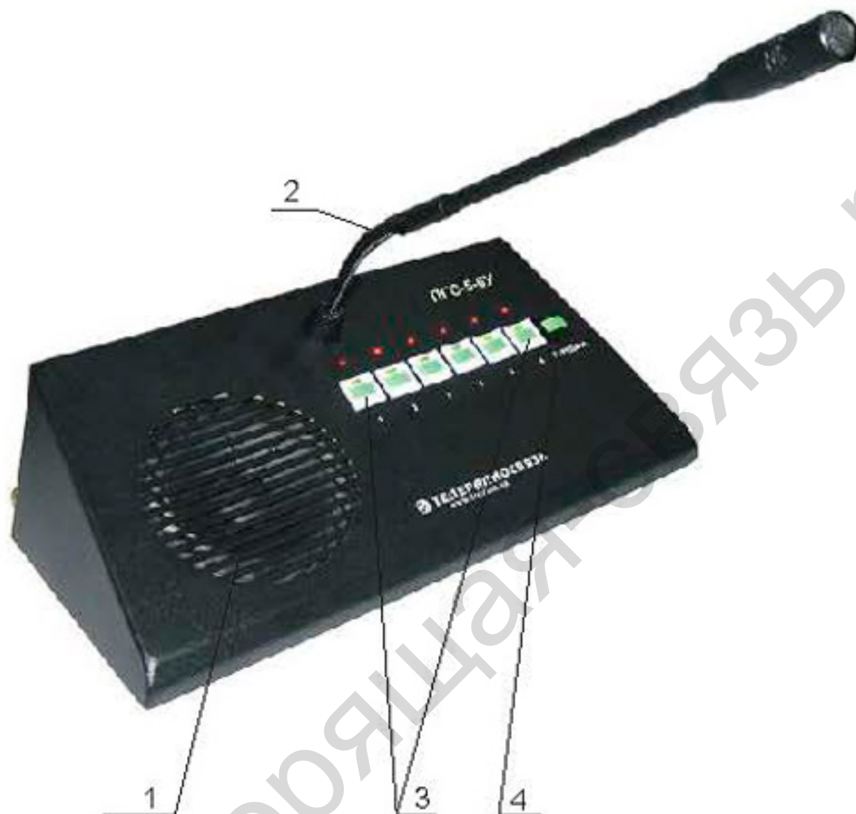
Рис.1 Вид сверху