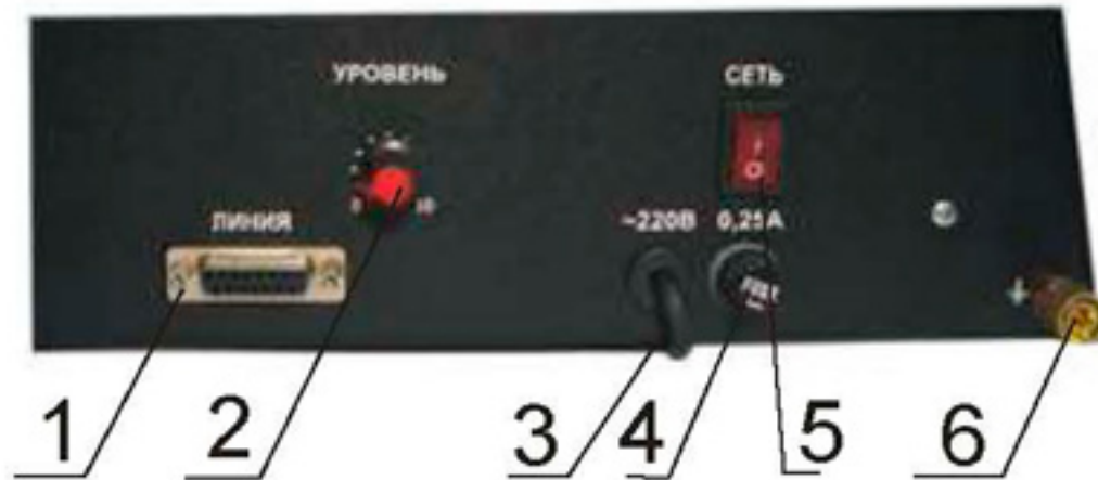
Рис.2 Вид сзади